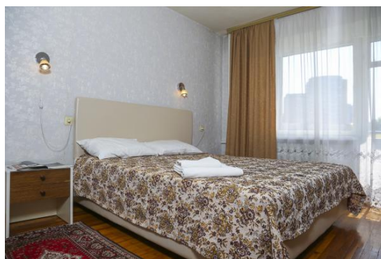
Номер «Стандарт Double» 650 гривен за номер в сутки